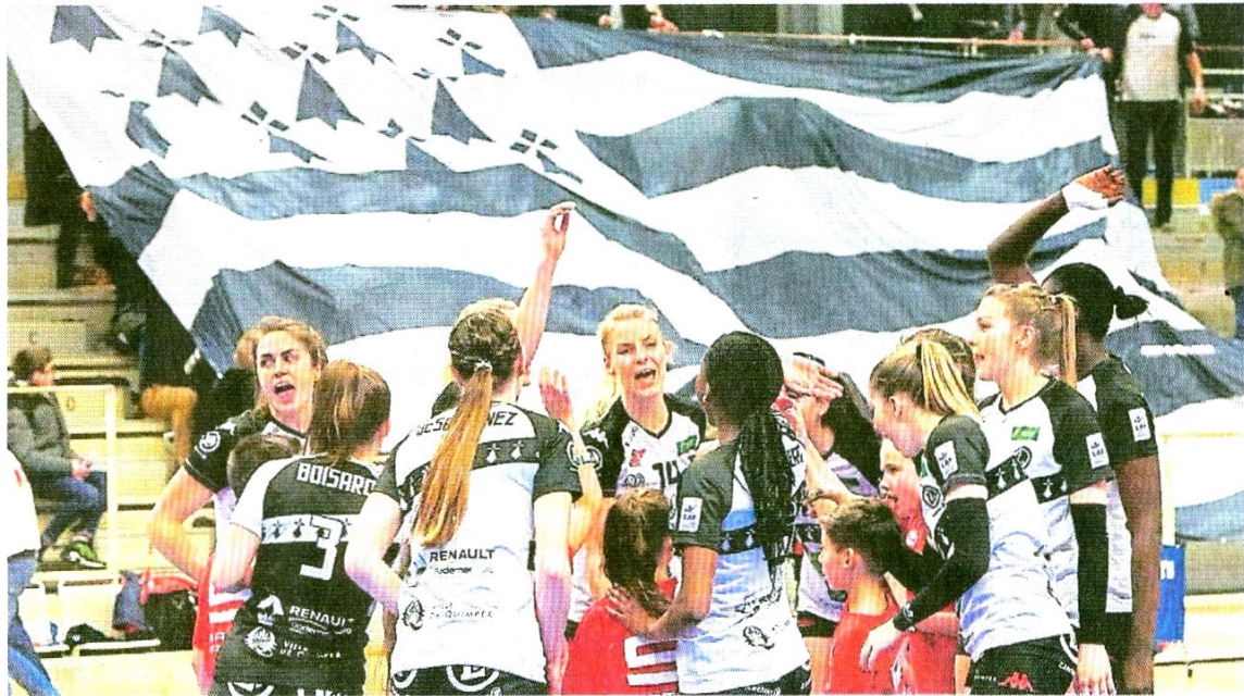
Le Quimper Volley devrait être soutenu par une Halle des Sports bien remplie, ce soir.

C'est l'atout majeur, la vague sur laquelle Carter et consorts peuvent,