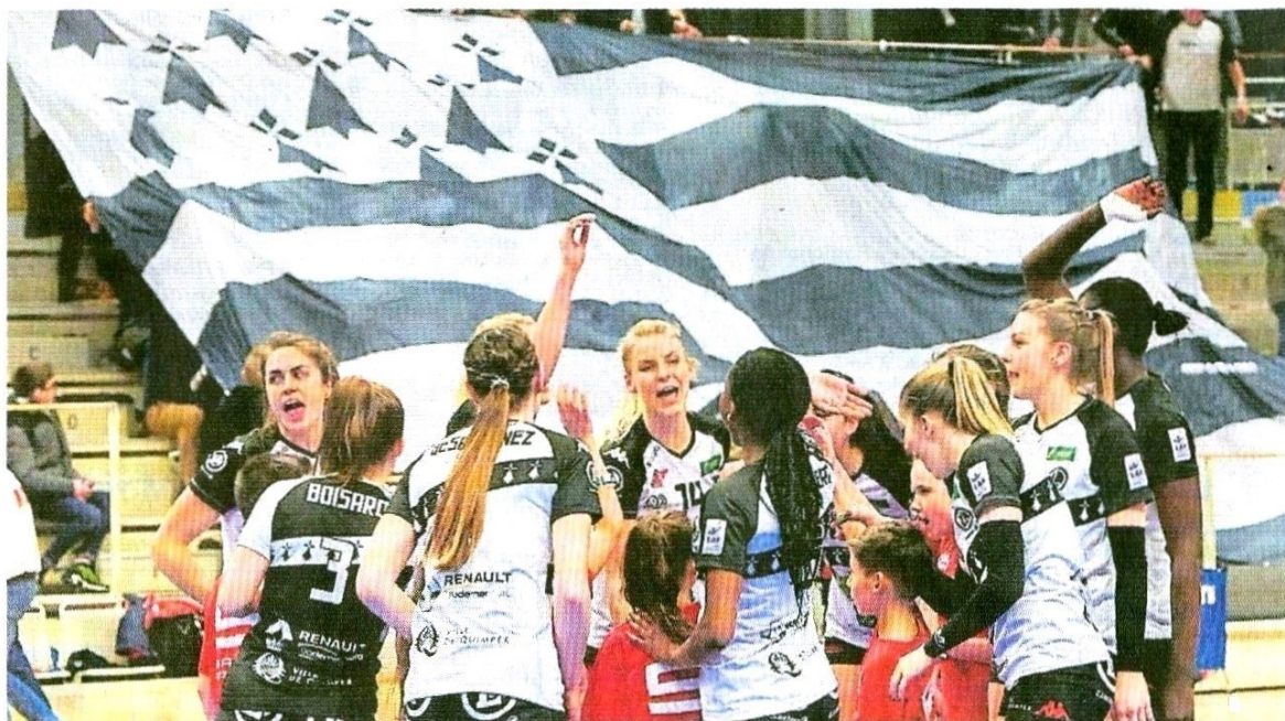
Le Quimper Volley devrait être soutenu par une Halle des Sports bien remplie, ce soir.

Le changement aurait valeur de symbole, d'autant que les Auvergnates disposent d'un calendrier plus scabreux que les Quimpéroises pour qui on s'accorde de plus en plus à dire que la réception de France Avenir, lors de la dernière journée, est une aubaine. Même si Dominique Duvivier se refuse à cette éventualité, « insoutenable », de devoir assurer une survie en LAF lors du dernier volet.