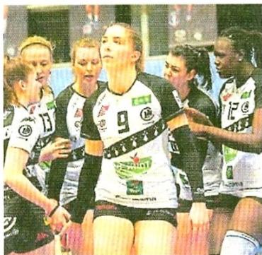
Le Quimper Volley 29 est dans l'attente.