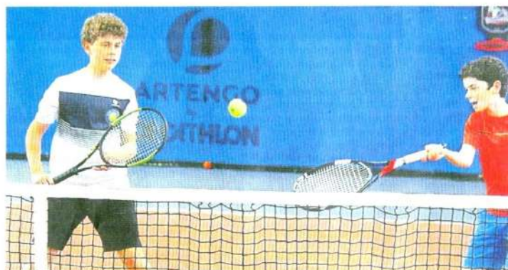
Le Tennis-club de Quimper s'associe au collège La Tourelle pour faire découvrir sa discipline.