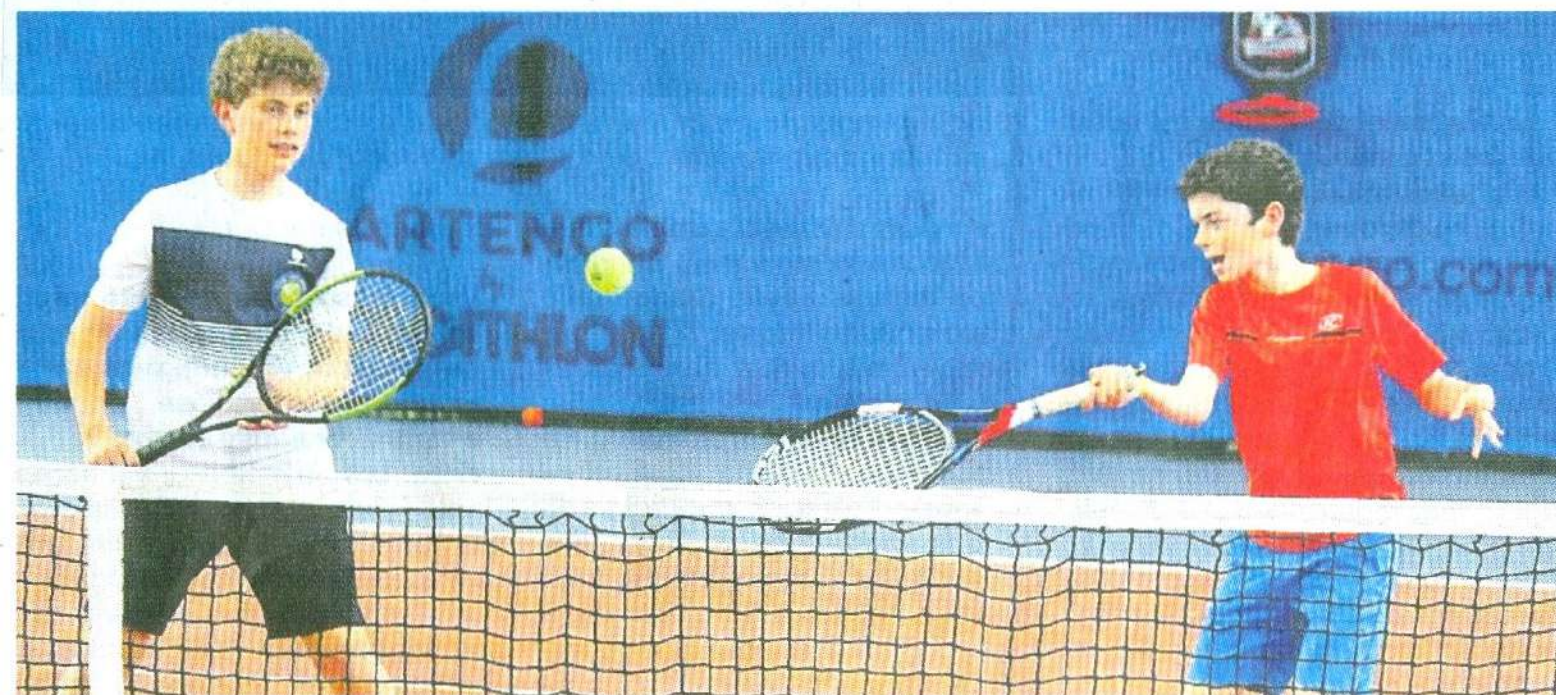
Le Tennis-club de Quimper s'associe au collège La Tourelle pour faire découvrir sa discipline.